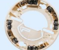
Art.-Nr.: 805590 Meldersockel Standard für Serie IQ8Quad

1 Stk. je 79,99€ ab 25 Stk. je 77,99€ ab 50 Stk. je 75,99€ ab 100 Stk. je 72,99€ Auf Anfrage