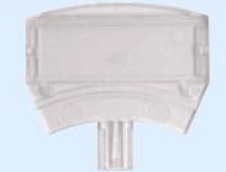
Art.-Nr.: 805576 Beschriftungsfeld für Meldersockel, VPE=10 Stück

1 Stk. je 224,99€ ab 3 Stk. je 209,99€ ab 5 Stk. je 204,99€ ab 10 Stk. je 198,99€ Auf Anfrage