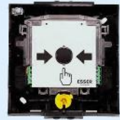
Art.-Nr.: 804905 IQ8 Handmelder Elektronikmodul m. Trenner u. ext. D-Linie

1 Stk. je 38,99€ ab 25 Stk. je 37,50€ ab 50 Stk. je 36,99€ ab 100 Stk. je 34,99€ Auf Anfrage