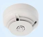
Artiki-Nr.: NFXI-OPT Optischer Rauchmelder Ringbus

1 Stk. je 3,89€ ab 60 Stk. je 3,79€ ab 120 Stk. je 3,55€ ab 240 Stk. je 3,49€ ab 300 Stk. je 3,39€ Auf Anfrage