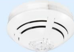
Art.-Nr.: 802373 OT Multisensor Melder IQ8Quad

1 Stk. je 3,99€ ab 100 Stk. je 3,29€ ab 300 Stk. je 3,09€ ab 500 Stk. je 2,89€ Auf Anfrage