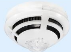
Art.-Nr.: 802384 O2T/So Multisensor Melder IQ8Quad mit integr. Warnton

1 Stk. je 59,99€ ab 60 Stk. je 52,99€ ab 120 Stk. je 48,99€ ab 240 Stk. je 46,99€ ab 300 Stk. je 44,49€ Auf Anfrage