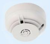
Art.-Nr.: NFXI-TDIFF Thermodifferentialmelder Ringbus

1 Stk. je 46,99€ ab 60 Stk. je 45,99€ ab 120 Stk. je 44,99€ ab 240 Stk. je 43,99€ ab 300 Stk. je 42,99€ Auf Anfrage