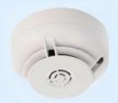
Art.-Nr.: NFXI-SMT2 Mehrfachsensormelder OT Ringbus

1 Stk. je 41,99€ ab 60 Stk. je 39,99€ ab 120 Stk. je 37,99€ ab 240 Stk. je 36,49€ ab 300 Stk. je 35,49€ Auf Anfrage