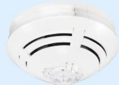
Art.-Nr.: 802374 O2T Multisensor Melder IQ8Quad

ab 1 VPE je 5,99€ ab 5 VPE je 5,19€ ab 10 VPE je 4,99€ ab 30 VPE je 4,89€ Auf Anfrage