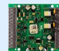
Art.-Nr.: 808623 esserbus Alarmierungskoppler Typ 4MG2R

1 Stk. je 38,99€ ab 60 Stk. je 37,49€ ab 120 Stk. je 36,99€ ab 240 Stk. je 35,89€ ab 300 Stk. je 34,49€ Auf Anfrage