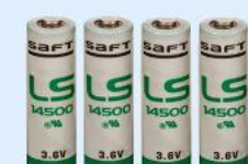
Art.-Nr.: 805597 Lithium-Batterie 3,6 V 2600 mAh Saft LS (VPE = 4 Stück)

1 Stk. je 20,89€ ab 10 Stk. je 19,89€ ab 30 Stk. je 18,69€ ab 50 Stk. je 17,99€ ab 100 Stk. je 17,69€ Auf Anfrage