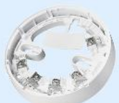
Art.-Nr.: B501AP Standardsockel Ringbus | Reinweiß

1 Stk. je 3,89€ ab 60 Stk. je 3,79€ ab 120 Stk. je 3,55€ ab 240 Stk. je 3,49€ ab 300 Stk. je 3,39€ Auf Anfrage