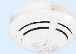
Art.-Nr.: 802371 Optischer Rauchmelder IQ8Quad

1 Stk. je 37,99€ ab 60 Stk. je 34,99€ ab 120 Stk. je 32,99€ ab 240 Stk. je 31,99€ ab 300 Stk. je 28,49€ Auf Anfrage