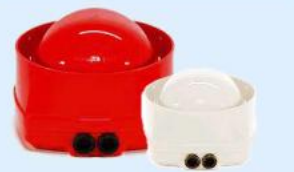
Art.-Nr.: 807205 (R/W) IQ8Alarm Plus Akust. Signalgeber EN54-3, Gehäuse rot oder weiß

1 Stk. je 11,99€ ab 25 Stk. je 10,99€ ab 50 Stk. je 10,19€ ab 100 Stk. je 9,98€ Auf Anfrage